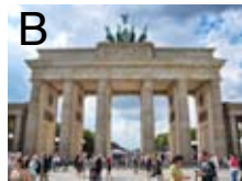
Brandenburger Tor in Berlin