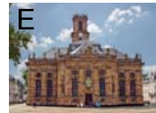
Ludwigskirche in Saarbrücken