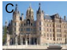
Schloss in Schwerin