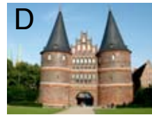
Holstentor in Lübeck