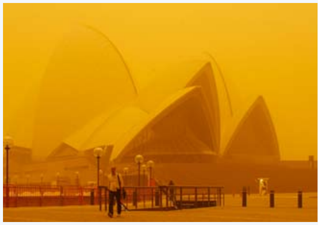
Ein Sturm hat den roten Sand bis in die Stadt Sydney getragen.