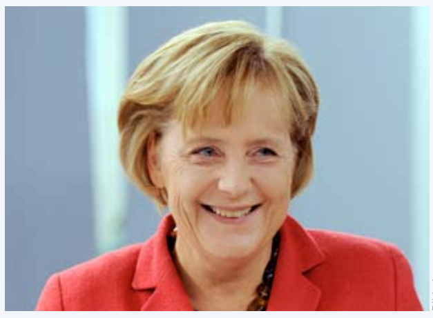
Angela Merkel freut sich.

Am 27. September war die Wahl des Bundestags. Die Partei CDU hat die meisten Wählerstimmen bekommen. Sie wird zusammen mit der FDP regieren. Frau Merkel bleibt Bundeskanzlerin. In den nächsten Wochen wird festgelegt, welche Politiker die Regierung bilden werden.