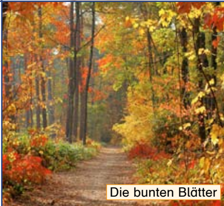
Die bunten Blätter